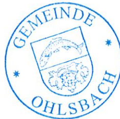
Bernd Bruder Bürgermeister